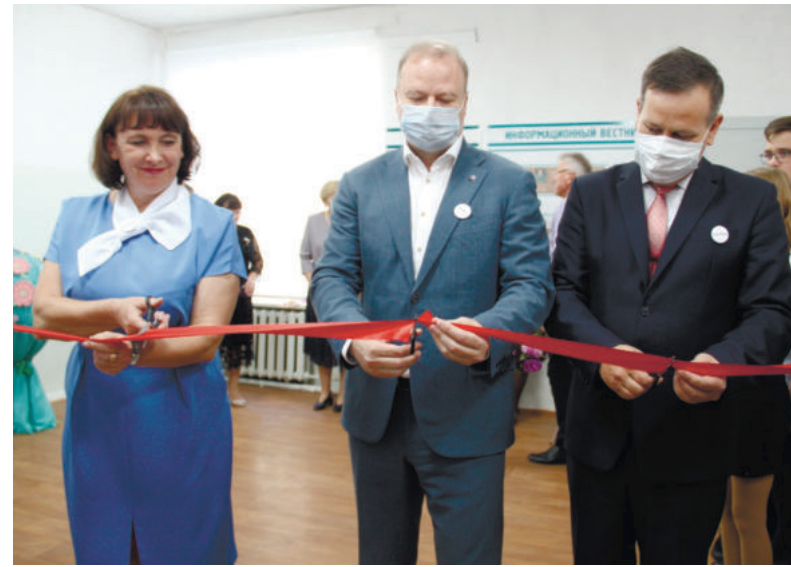
Открытие «Точки роста» в Речкаловской школе